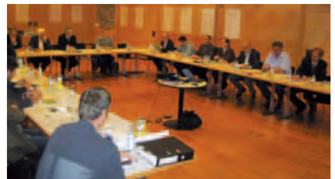
Links: Workshop Kultur, oben: Walgaukonferenz.