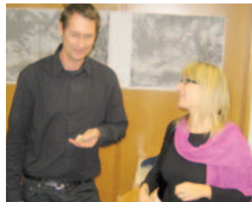
In kleinen Gruppen gezielt gemeinsame Schritte gehen.

Neben den Arbeitsgruppen gibt es noch die Workshops, in denen aktive Menschen mit ähnlichen Interessen zusammenkommen. Ob Kulturschaffende, Jugendbetreuer, Sozialzentren, regionale Vertreter oder Naturschützer - der Austausch von Erfahrungen und die gegenseitige Information über laufende Projekte ist ein wichtiger Schritt zum regionalen Zusammenhalt.