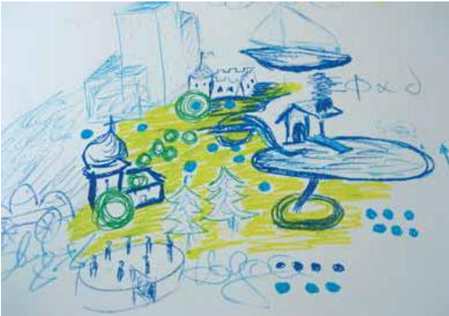
Walgauforum 2009: „Kunst auf der Tischdecke“