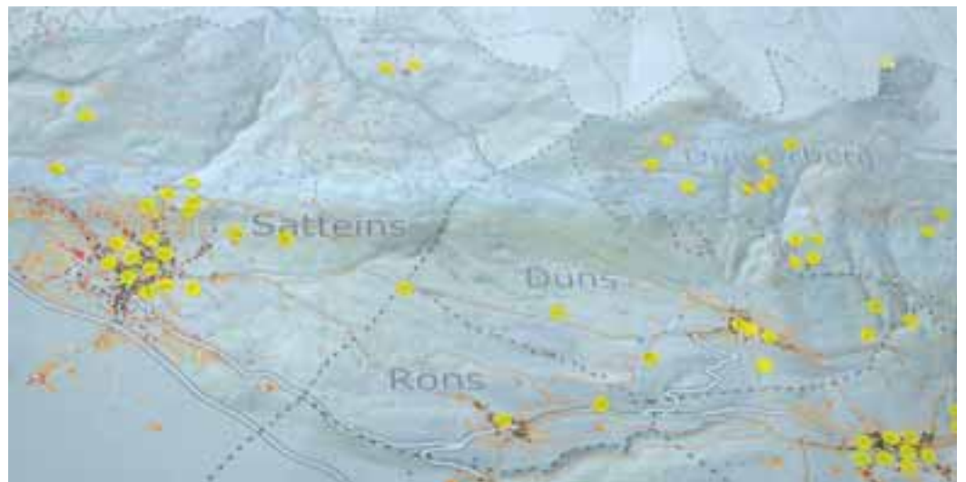
Karte der Stärken