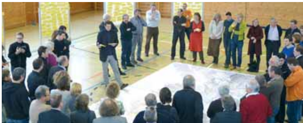
Impressionen vom Walgauforum.

Das Walgau-Wiki wurde freigeschaltet und kann unter http://www.wiki.imwalgau.at angesehen und - nach einer kurzen Anmeldung per E-mail - auch gerne bearbeitet werden.