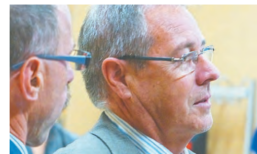
... und das in allen 14 Walgau-Gemeinden.