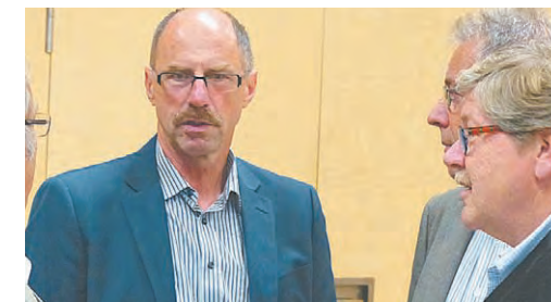
Die Regio Im Walgau stellt erfreut fest, dass die Walgau-Gemeinden näher rücken.