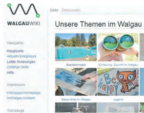
Das WalgauWiki ist ein mögliches Instrument,....