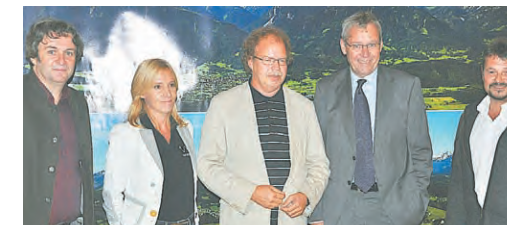
Das Land Vorarlberg finanzierte 2012 50% der angefallenen Projektkosten.