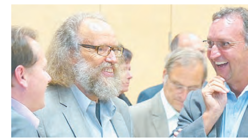
Die Landesraumplanung ist mit den Walgau-Gemeinden auf Augenhöhe.