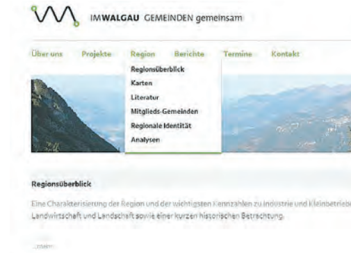
...und bietet Informationen rund um die Regio.