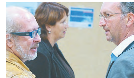
Delegierte und Bürgermeister sind im Austausch.