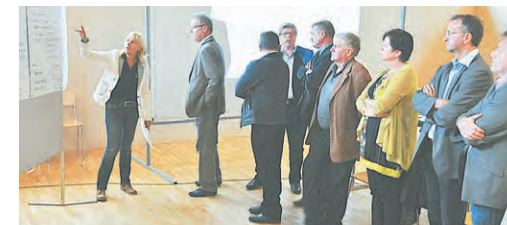
Die Vorbereitung zur Delegiertenversammlung wird im Vorstand diskutiert.