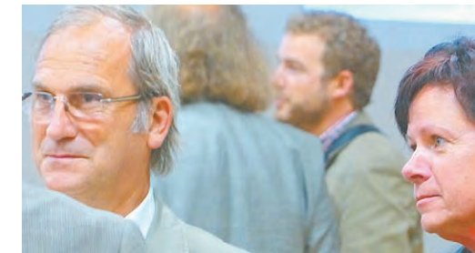
Auf Bürgermeisterebene herrscht sehr gutes Einvernehmen ...