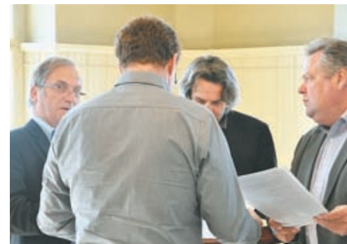
...zeigten andere Blickwinkel, jedoch Eindeutigkeit.