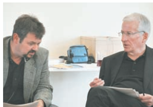
Die Workshops mit Bürgermeistern aus Feldkirch,...

Im Grunde geht es bei diesem Projekt um verschiedene Themen, die sich unter dem Begriff ‚Bildungsregion‘ zusammenfassen lassen. Das beinhaltet z.B.: Wie finden Industrie, Handwerk und Gewerbe ausreichend Lehr- linge , wenn die Zahl der Jugendlichen zurückgeht? Wie gelingt es, die Jugendlichen, die zum Studium gehen, danach zur Rückkehr in die Region zu motivieren? Wie arbeiten Bildungs- und Betreuungseinrichtungen zukünftig zusammen, um ihr Angebot zu optimieren? Welche Rolle spielen die Unternehmen dabei? Welche zusätzlichen Bildungseinrichtungen braucht die Region?