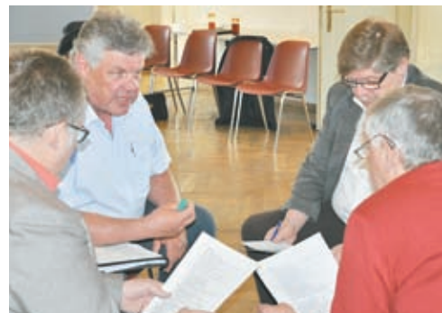
... dem Vorderland, dem Walgau und Bludenz ...