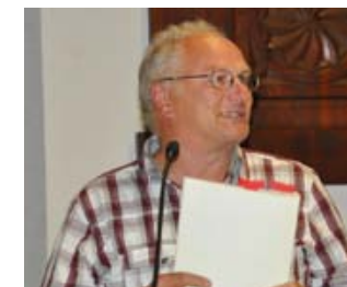
Wortmeldungen zur Diskussion um knappe Landwirtschaftsflächen.