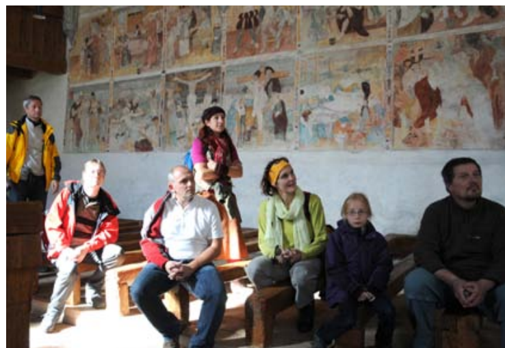
Zahlreiche Veranstaltungen bietet auch heuer die Kulturgütersammlung Walgau.