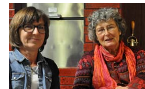
Vielen Dank an das Buralädele Ludesch für das gut gelaunte und bunte Catering.