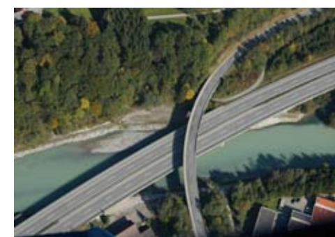
Welche Entwicklungen sind wünschenswert und welche können wir selbst beeinflussen?