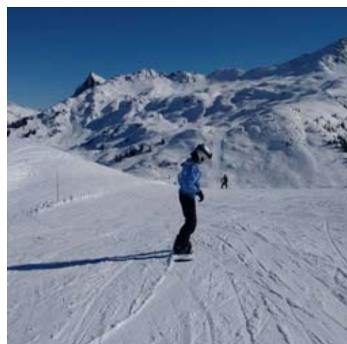
Junge Flüchtlinge beim Snowboarden am Sonnenkopf.

Die Regio Im Walgau richtet den Blick in die Zukunft: Wie stellen wir uns die Zukunft im Walgau vor – das ist ein Thema, das sich wie ein ‚roter Faden‘ durch die Regio Im Walgau zieht. Das Leitbild ‚Zukunft Im Walgau‘, das gemeinsame Räumliche Entwicklungskonzept, das