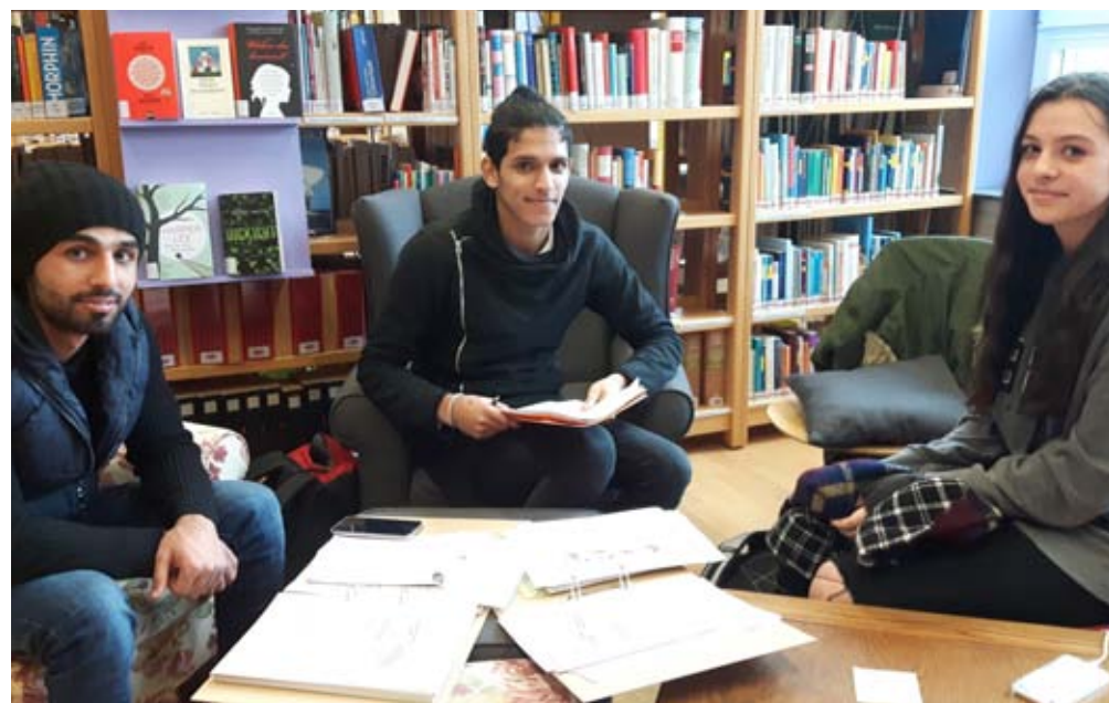
Deutschkurs im BG Bludenz

Wie eng die einzelnen Formen des Engagements miteinander verschränkt sind, wurde jüngst in Frastanz deutlich. Dank der Spenden von engagierten FrastanzerInnen konnten vier junge Asylsuchende an einer Snowboard-Woche am Sonnenkopf teilnehmen. Diese Woche wird bereits seit mehreren Jahren von der Offenen Jugendarbeit Bludenz