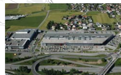
Fotos aus dem zweiten Walgaubuch: Was sind die wichtigen ‚Baustellen‘ unserer Kinder?

Das erste Walgaubuch wollte neugierig auf die Region der Gegenwart machen, das zweite Walgaubuch zeigt die regionalen Ziele und Visionen. Es beschreibt die aktuellen Herausforderungen und wie die Region bisher darauf reagiert hat.