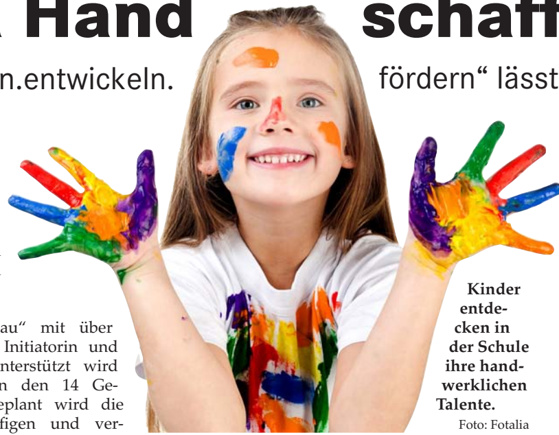
Kinder entdecken in der Schule ihre handwerklichen Talente.

fördern“ lässt Kinder in der Schule ihre Fähigkeiten erspüren