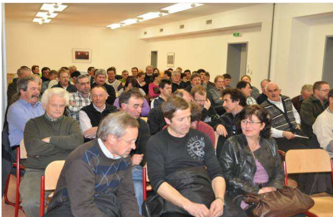
Diskussion mit Landwirten in Bürs

Maßnahme 3.x Neben den Arbeitsgruppen ‚Regionalgeld‘ und ‚Bludenz – Bürs – Nüziders‘ haben uns vor allem die Landwirtschaftsaktivitäten in Atem gehalten. Dazu kam ein Workshop ‚Medienarbeit für Kulturschaffende‘, weitere Besprechungen zu den Themen Burgen, Museen und Verkehr / zweite Pfänderröhre sind terminiert.