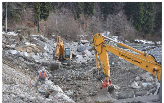
Illsanierung bei Bludenz